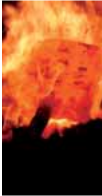
Damastpaket im Feuer.