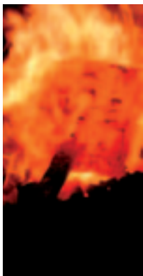
Paquet de damas dans le feu de forge.