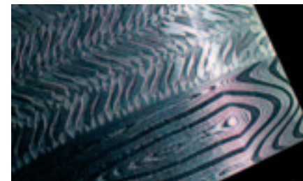
Damas en torsade étoilée avec tranchant rapporté.